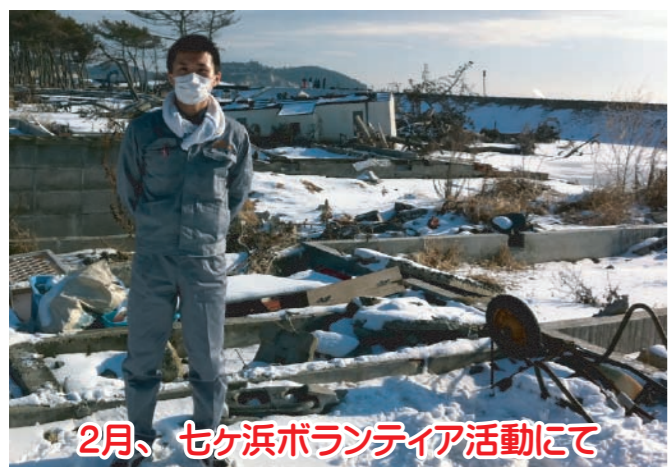
2月、セヶ浜ボランティア活動にて