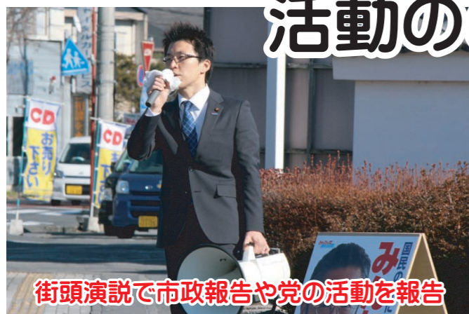
街頭演説で市政報告や党の活動を報告