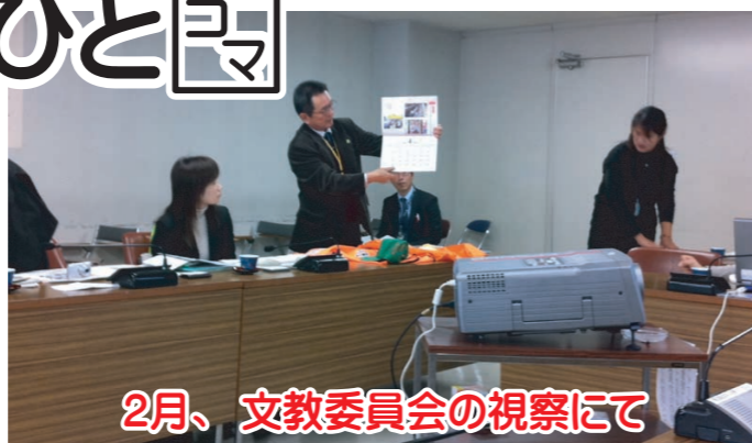
2月、文教委員会の視察にて