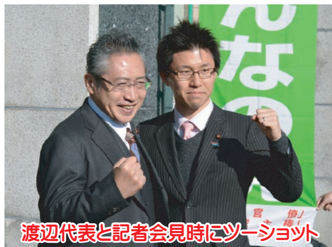
渡辺代表と記者会見時にツーショット